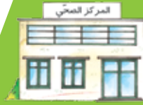
زيارات متكررة الى المركز الصحي